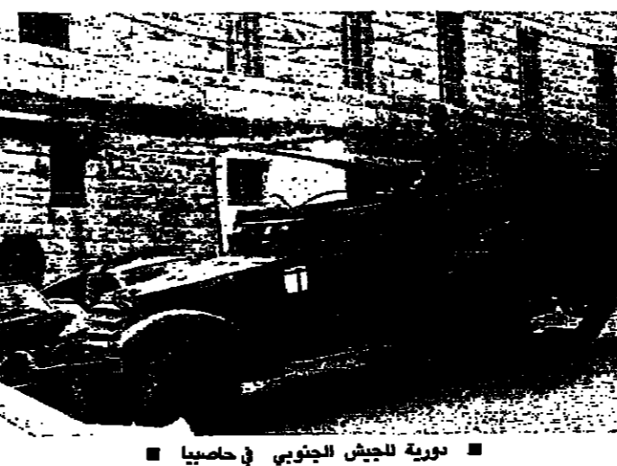
تورية للجيش الجنوبي في حاصبيا